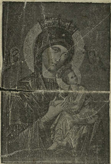
Matka Boska Nieustającej Pomocy