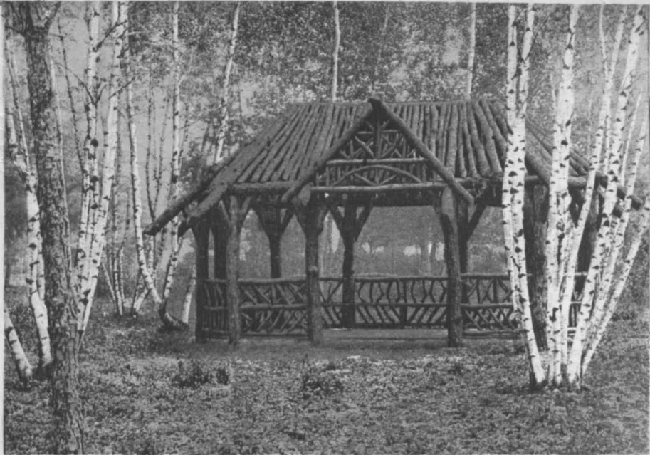
5967. WHITE BIRCH GROVE SHELTER, WHALOM PARK.