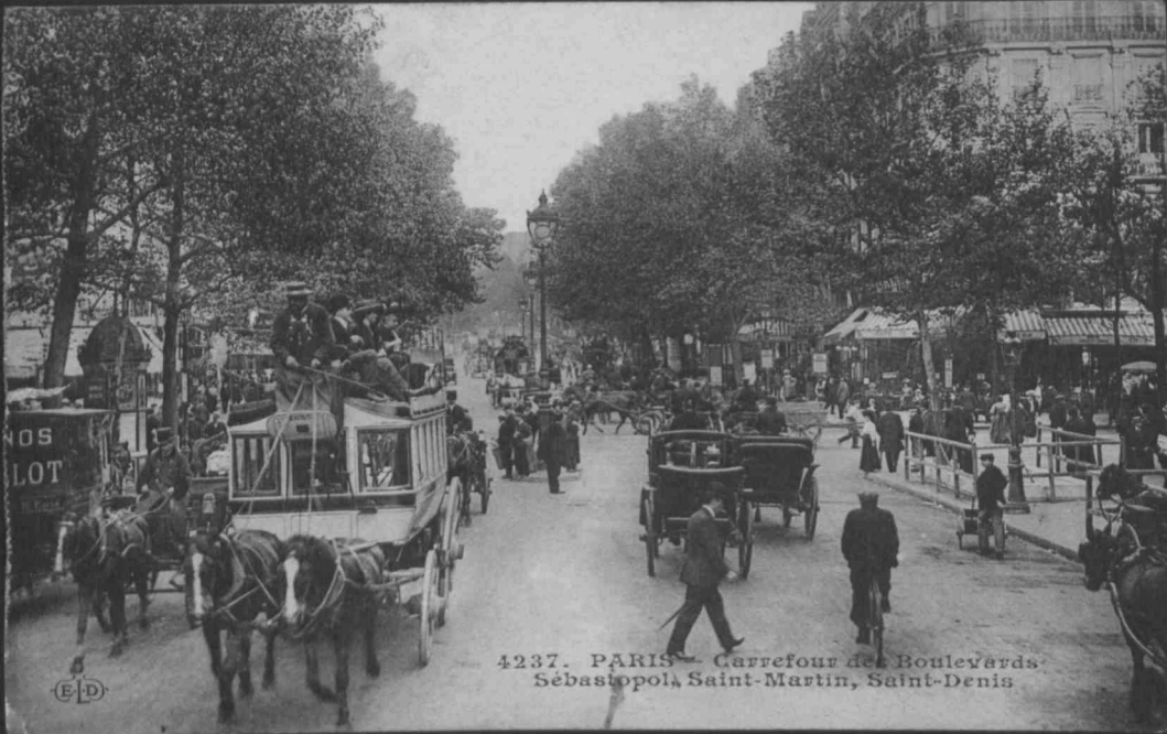
4237. PARIS - Carrefour des Boulevards Sébastopol, Saint-Martin, Saint-Denis