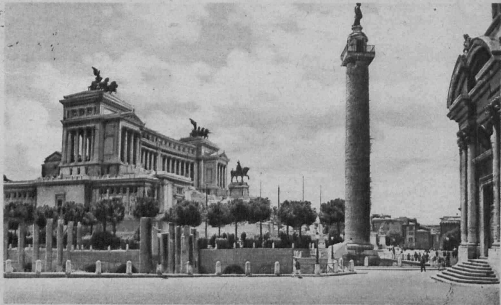
Roma - Il Monumento a Vitt. Eman. 2° e la Colonna Traiana