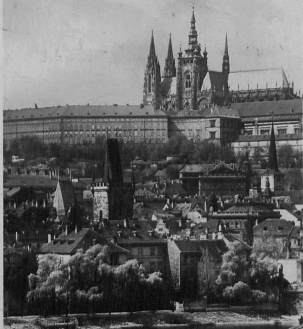
PRAHA - HRADČANY .