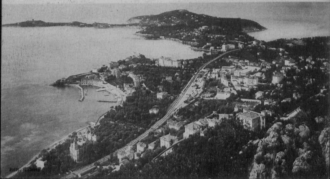
341. - BEAULIEU. - Vue générale et Saint-Jean-Cap-Ferrat Vue prise de la Nouvelle Corniche General view and St-Jean-Cap-Ferrat - View taken from the New Corniche