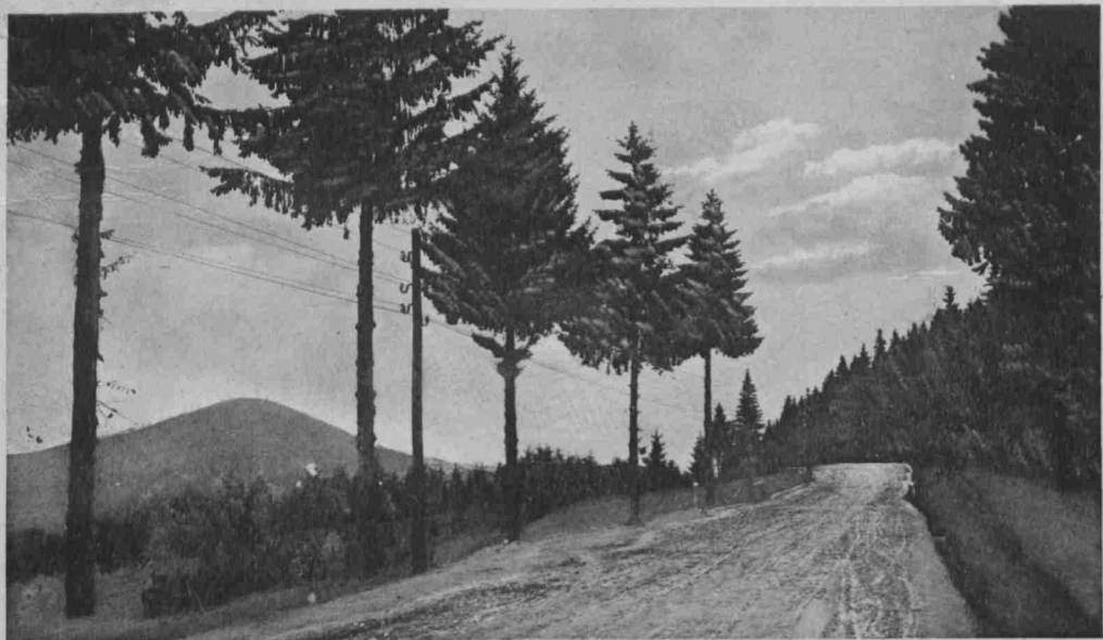
Okolice Kosowa. Droga do Pistynia. Околиця Косова. Дорога до Пістиня.