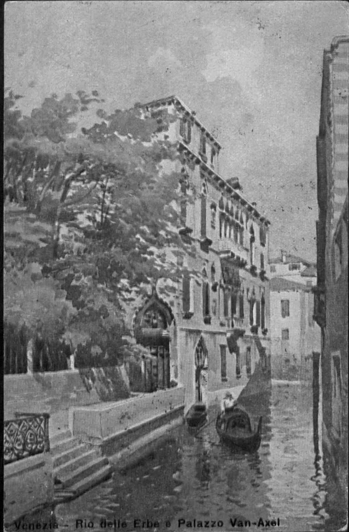
Venezia - Rio delle Erbe e Palazzo Van-Axel