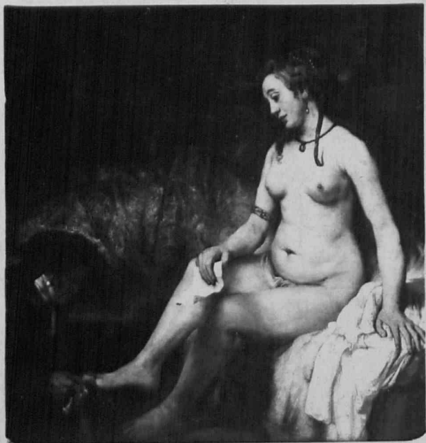
2549 - MUSÉE DU LOUVRE Rembrandt - Bethsabée au bain.