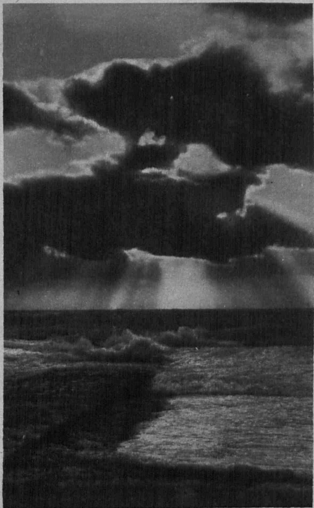
Kovastunoy burxy Ju Arguin - Boi Don M. Basse