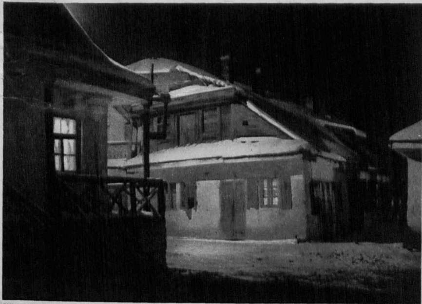
KRZEMIENIEC. Dzielnica zabytkowa w nocy.