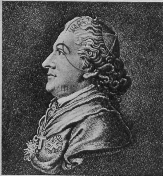
IGNACY KRASICKI, 1735 — 1801.

Znakomity poeta czasów króla Stanisława Augusta. Autor znanych bajek i poematów satyrycznych.