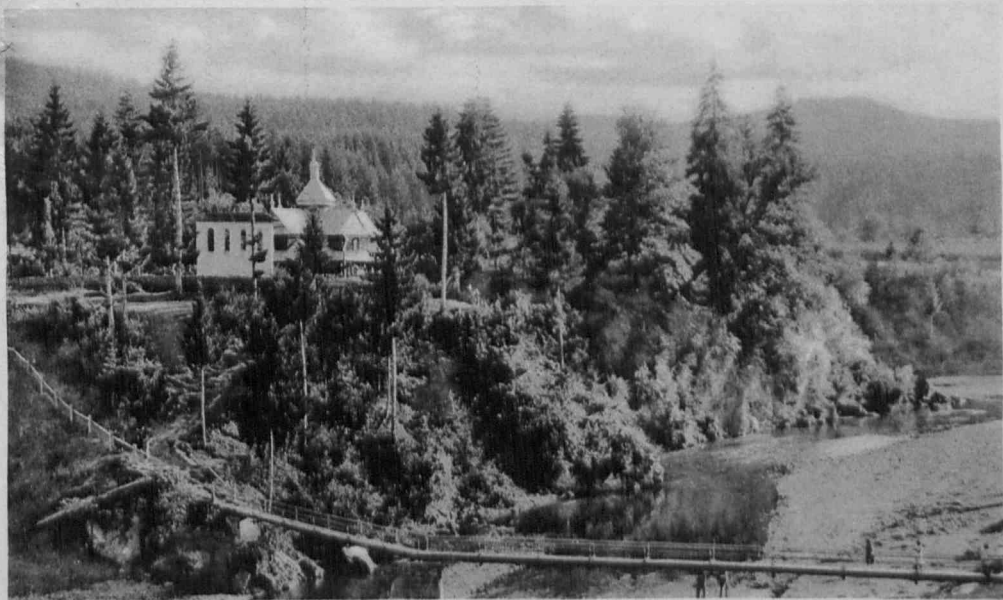
Okolice Kosowa – Cerkiewka w Pistyniu Околиці Косова – Церковця в Пістині